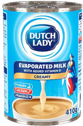
Dutch Lady Evaporated Milk - 무가당