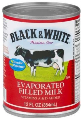
Black&White Evaporated Milk - 무가당